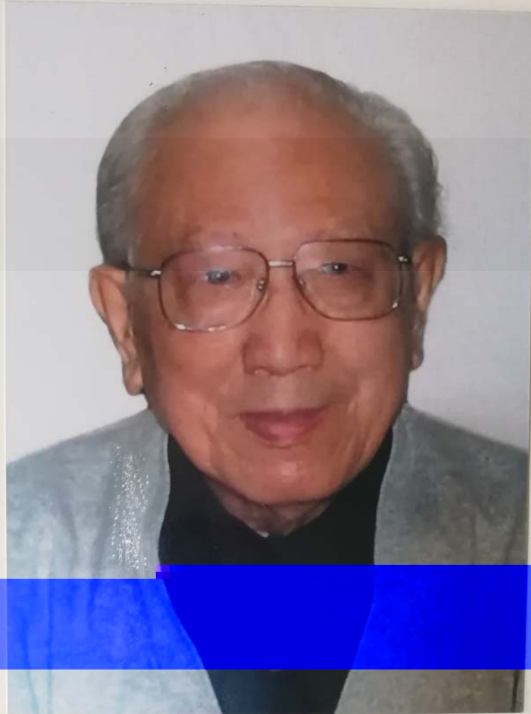
吴祖光同志纪念册